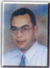
د. أحمد خالد توفيق